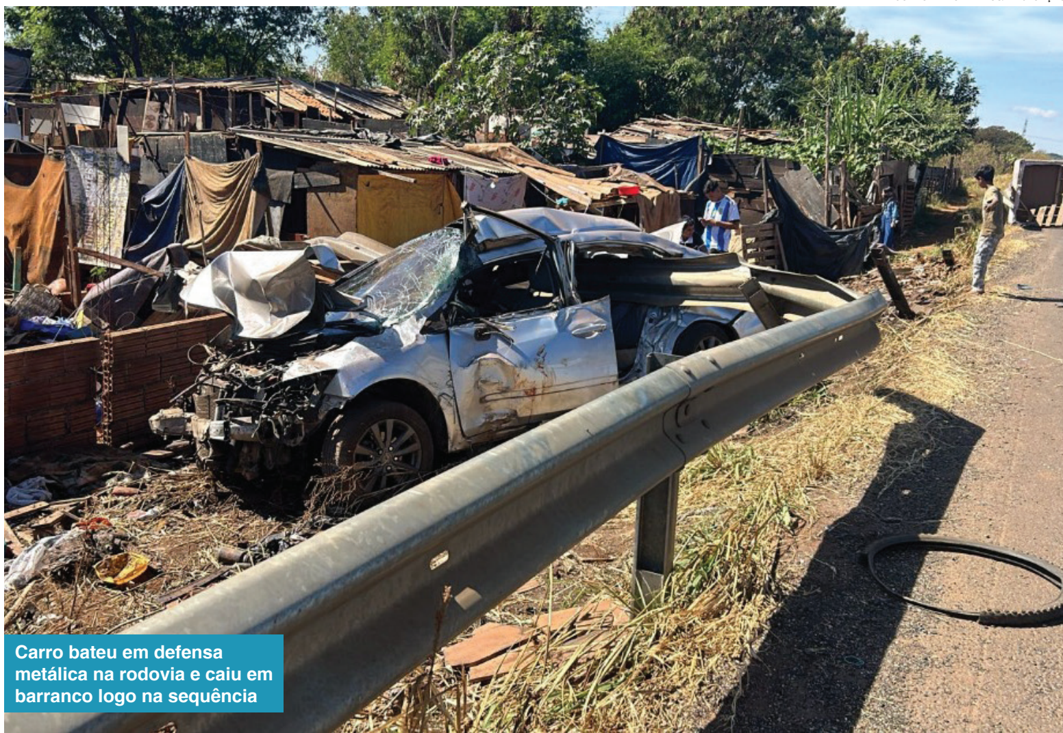
Carro bateu em defesa metálica na rodovia e caiu em barranco logo na sequência