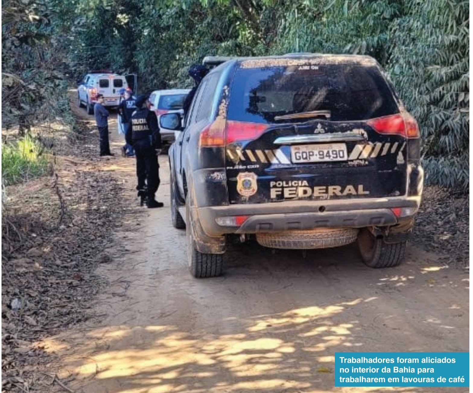
Trabalhadores foram aliciados no interior da Bahia para trabalharem em lavouras de café